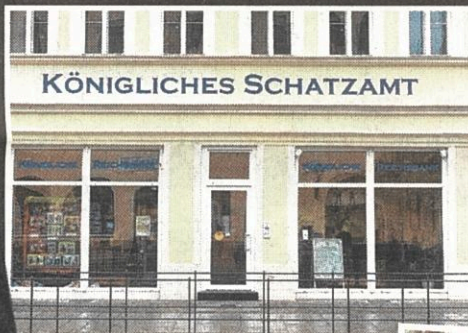
▲ Die einstige Königliche Schatz- amt in Wittenberg darf der Monarch vorerst nicht betreten