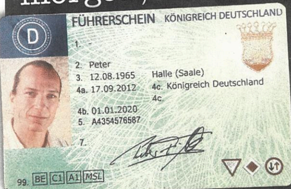
▲ Dieser grüne Führerschein des Königreichs Deutschland soll seinem Inhaber „freie Fahrt nach freiem Ermessen“ ermöglichen

Verwaltungsgericht entscheidet morgen, ob der Führerschein des selbsternannten Monarchen gültig ist