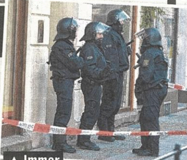
▲ Immer wieder kam die Polizei im Großaufgebot zu Razzien im Wittenberger Königreich

Verrückt, aber der König hat gute Karten. weiter fahren zu dürfen. Denn die Verwaltungs- richter gehen zumin- dest nicht davon aus, dass seine Fahrerlaub- nis mit der Abgabe des BRD-Führerscheins erlo- schen ist.