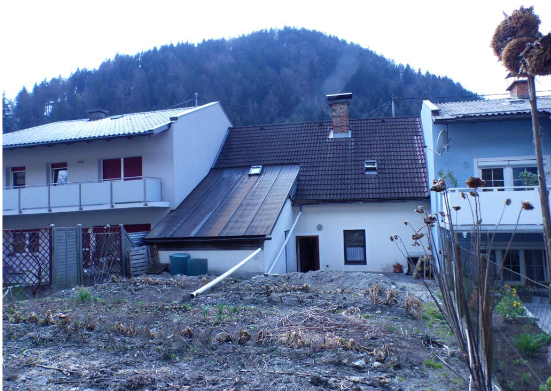
Bild 6 Gebäudeansicht Ostseite mit Gartenareal Grundstück 148