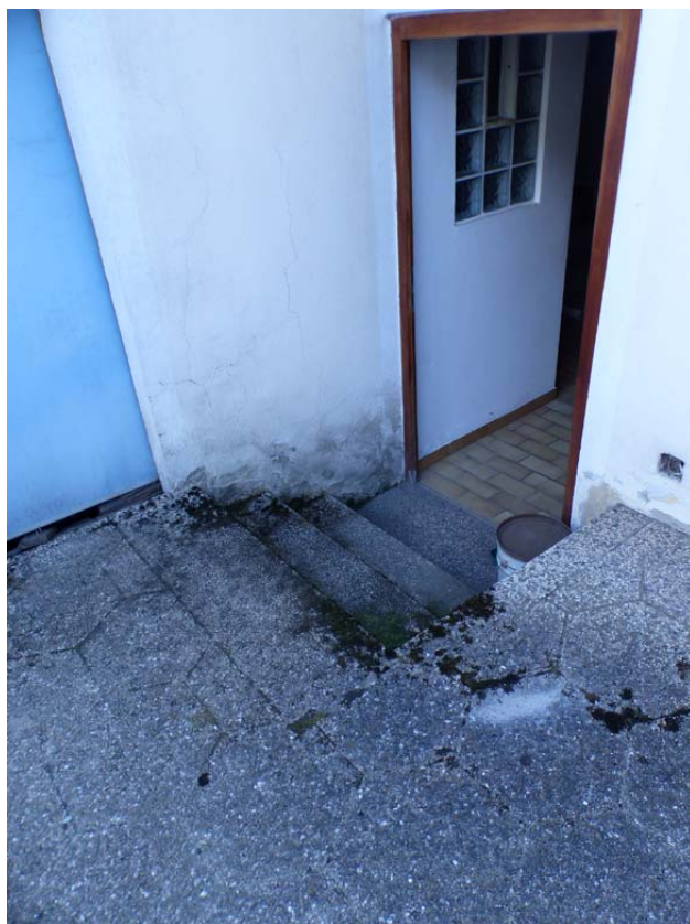
Bild 11 Hofseitiger Ausgang