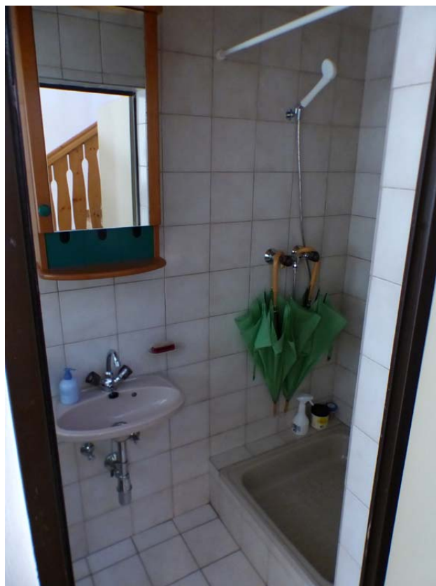
Bild 15 EG WC mit Dusche