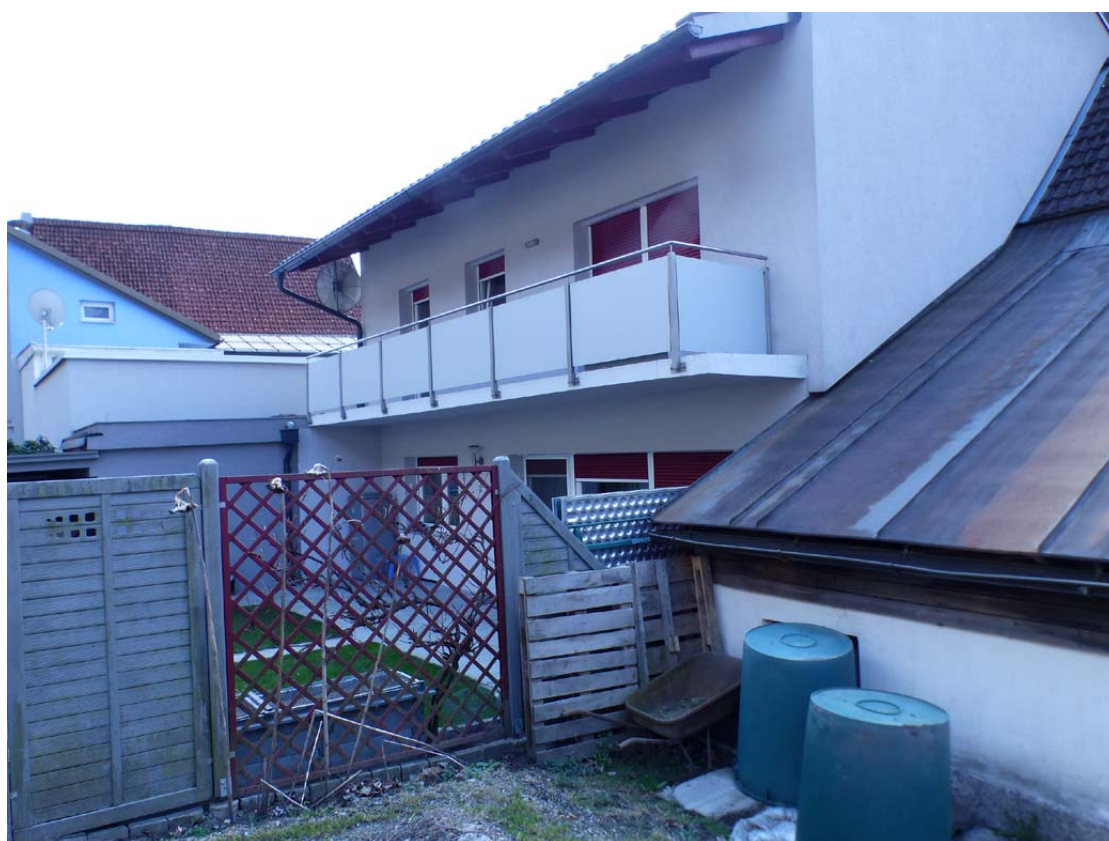
Bild 8 Gartenanlage Nachbargebäude Südseite