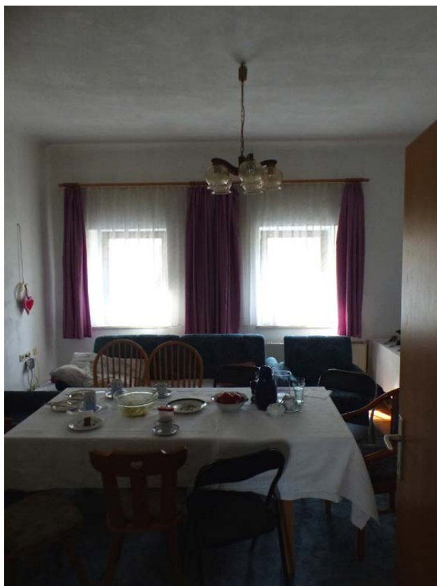
Bild 27 EG Wohnraum mit Fenstern zur Schulhausgasse