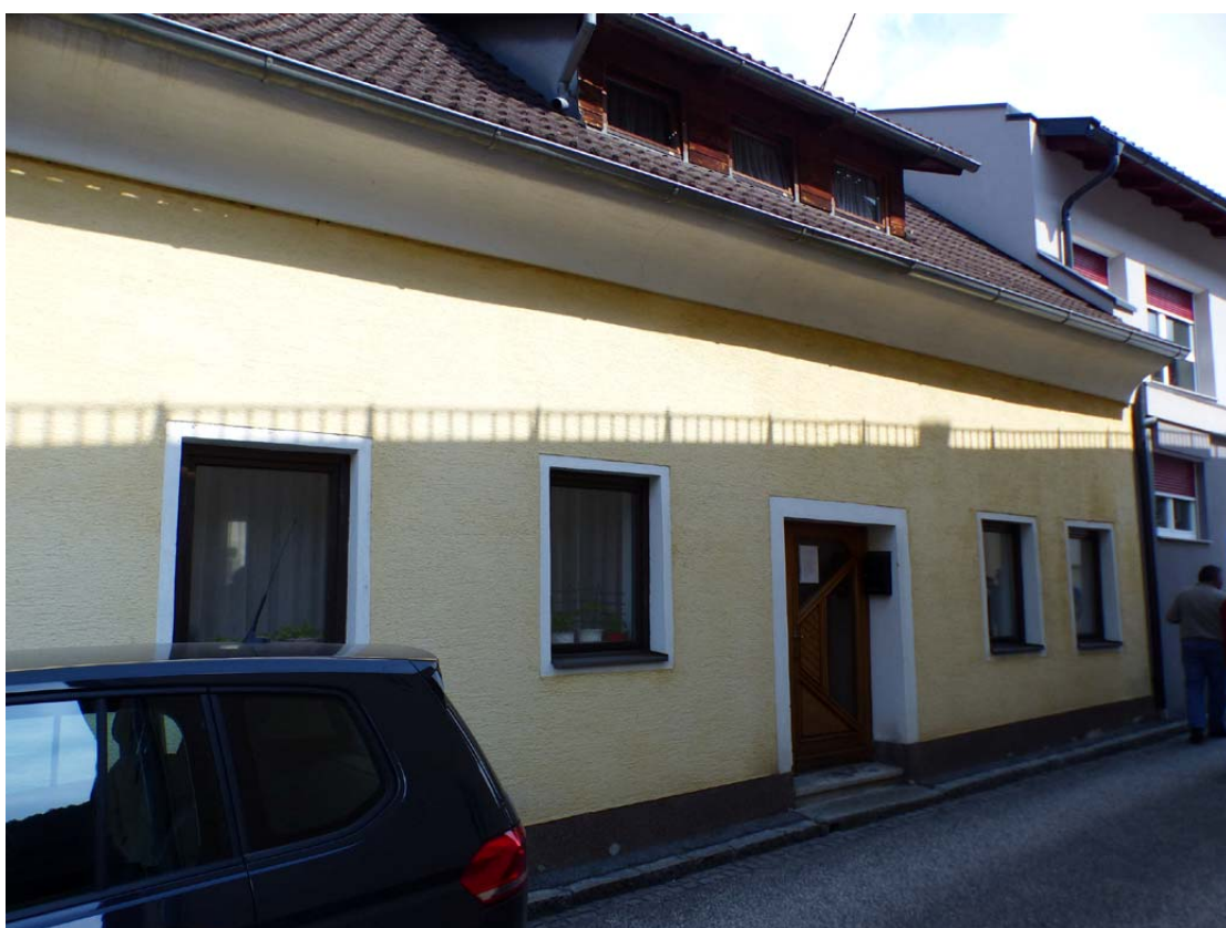
Bild 2 Westfassade entlang der Schulhausgasse mit Hauseingangstüre und Dachgaube