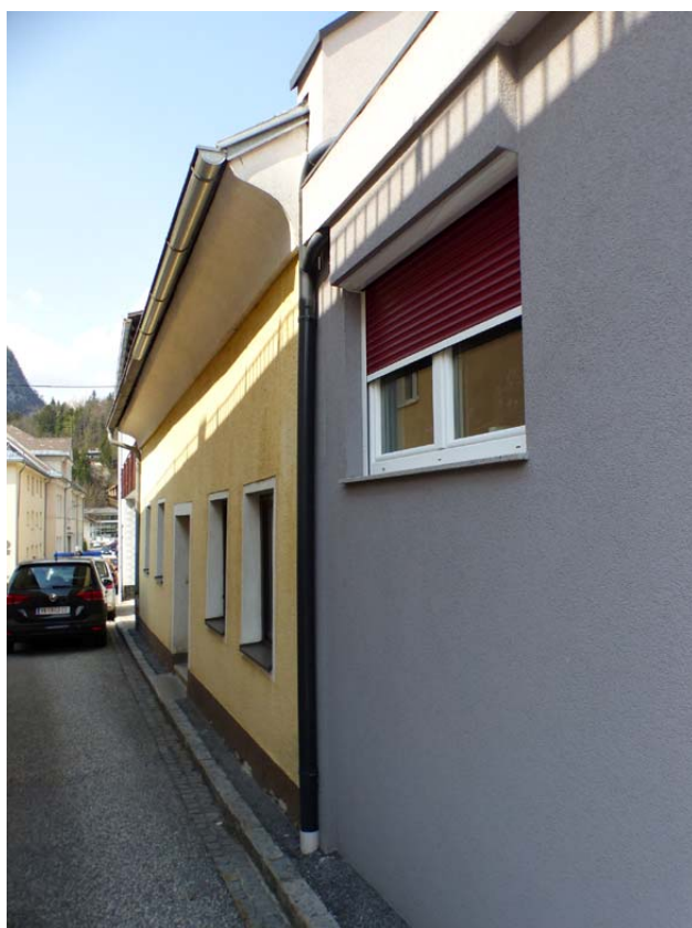
Bild 4 Schulhausgasse Fahrtrichtung Norden zur Volksschule mit Hausanschluss an der Südwestecke