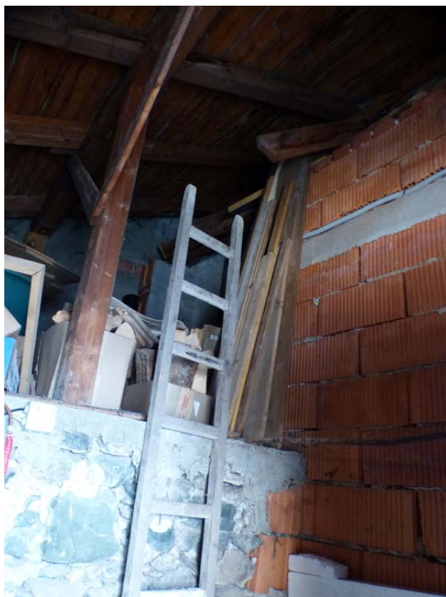
Bild 43 Innenansicht Nebengebäude mit Dachbodenzugang