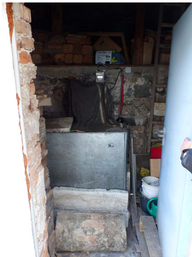
Bild 41 Innenansicht Nebengebäude mit Öltank