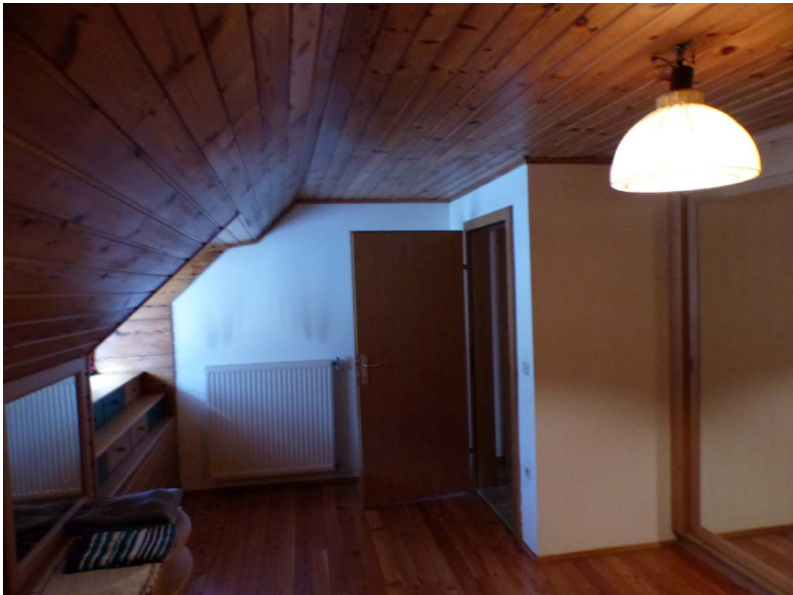
Bild 39 DG Schlafzimmer mit Dachgaube zur Schulhausgasse