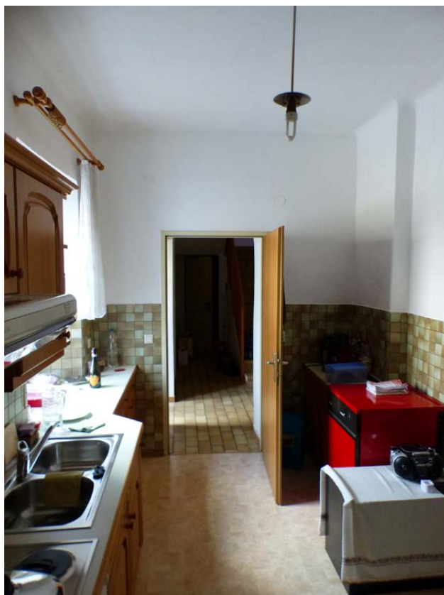
Bild 29 EG Küche mit Zugang vom Flur