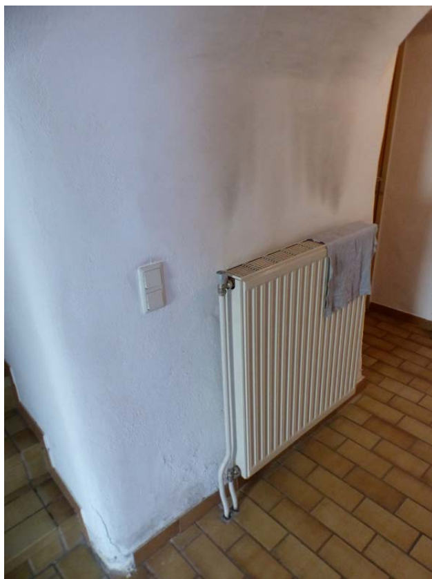
Bild 21 EG Flur mit Heizkörper