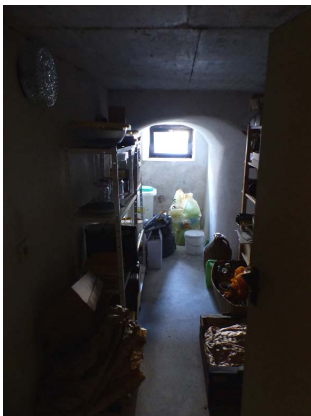
Bild 18 EG Kellerraum im hofseitigem Anbau