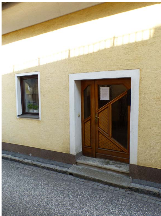
Bild 3 Hauseingangstüre von der Schulhausgasse