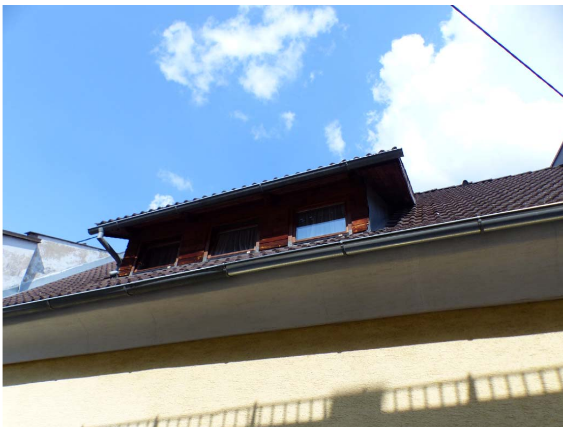
Bild 44 Dachgaubenansicht Schulhausgasse von der Westseite