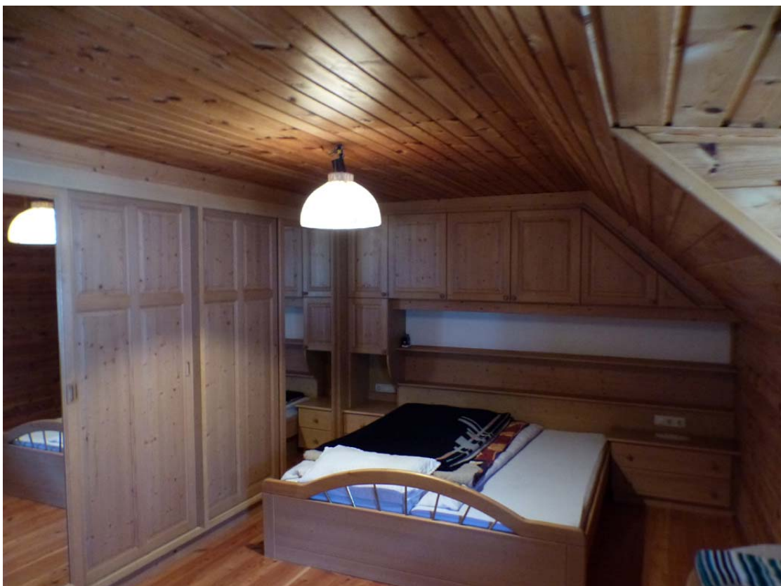
Bild 38 DG Schlafzimmer an der Südwestseite