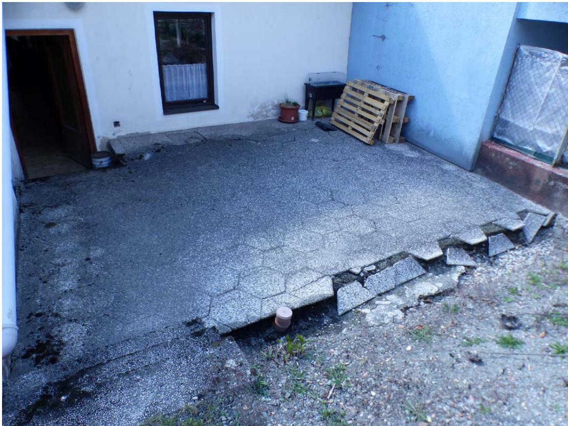
Bild 9 Hofseitige Terrassenanlage mit Hauszugang an der Ostseite