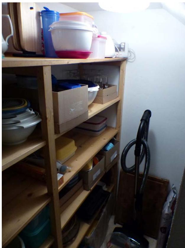
Bild 17 EG Abstellraum unter Stiegenpodest