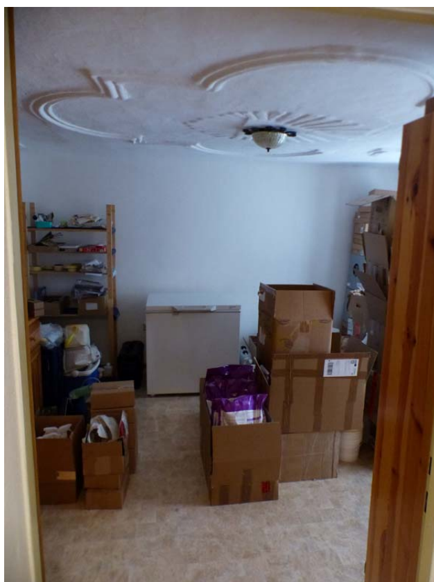
Bild 22 EG Zimmer an der Südwestseite