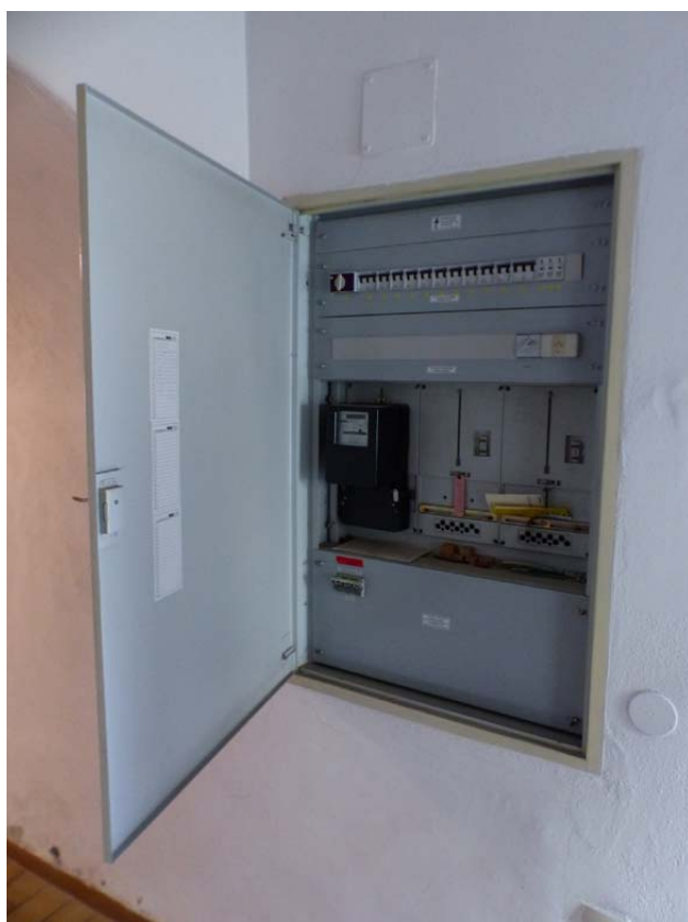
Bild 14 EG Flur mit E-Verteileranlage