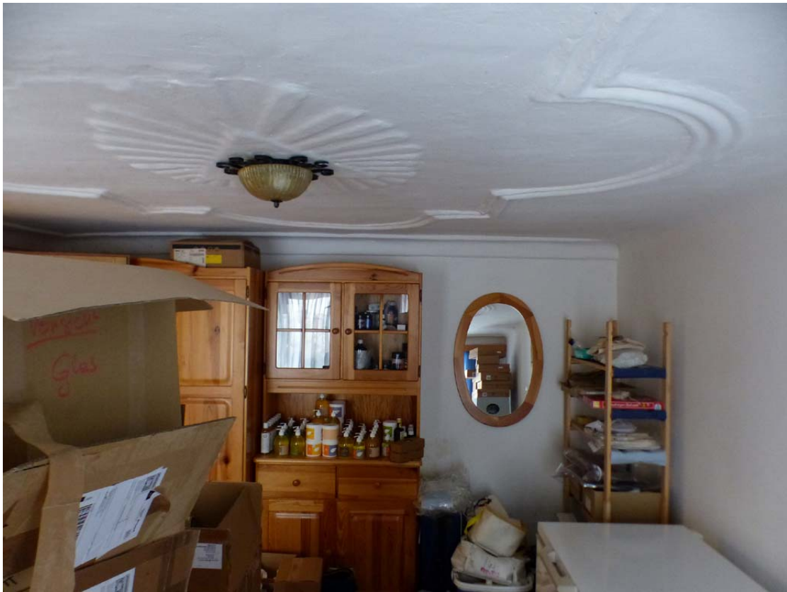
Bild 23 EG Zimmer an der Südwestseite