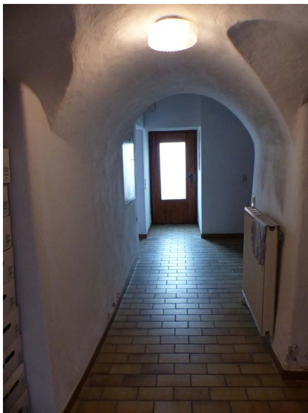
Bild 25 EG Flur mit hofseitigem Ausgang