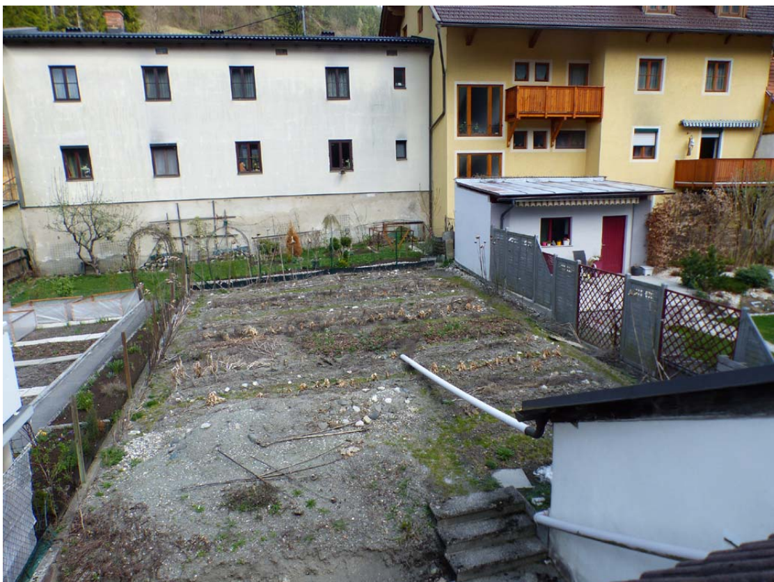
Bild 10 Gartengrundstück Nr. 148 Ansicht von der Westseite