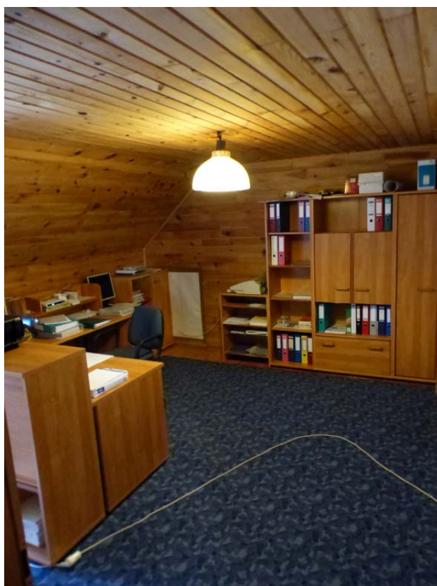
Bild 36 DG Büro an der Nordwestseite