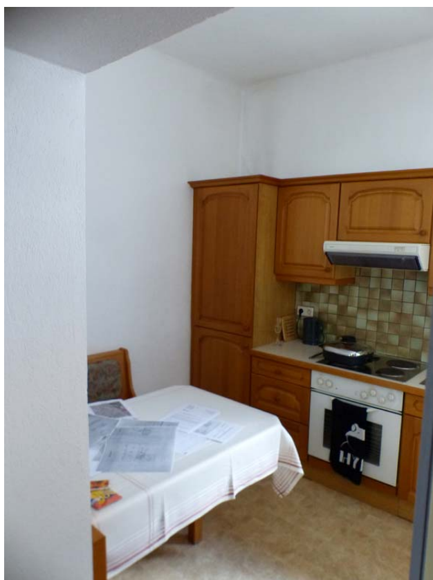
Bild 30 EG Küche mit Esstisch und Küchenverbau