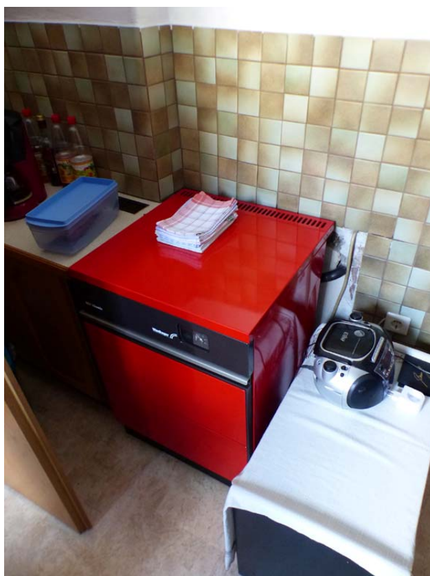
Bild 28 EG Etagenherd in der Küche