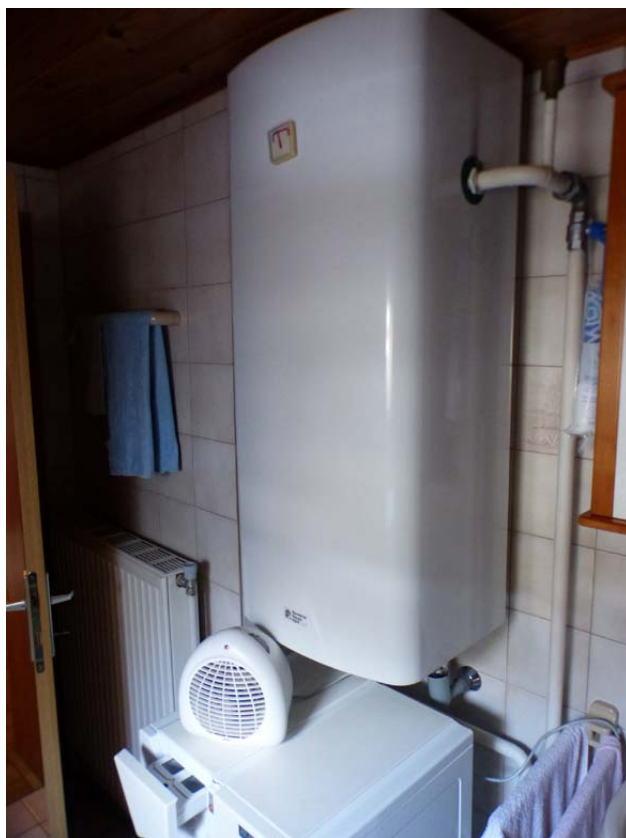
Bild 35 DG Badezimmer mit Warmwasserboiler