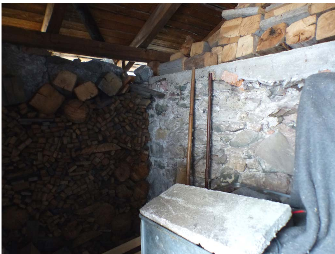
Bild 42 Innenansicht Nebengebäude Holzlagerraum und Öltank