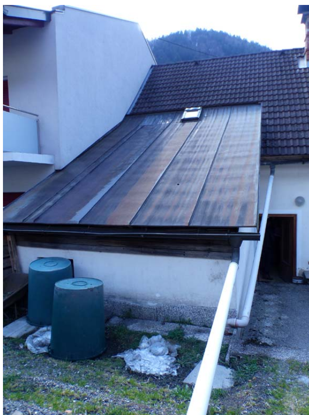
Bild 7 Nebengebäude / Keller Hofanbau Ansicht von der Ostseite mit angebautem Nachbargebäude an der Südseite