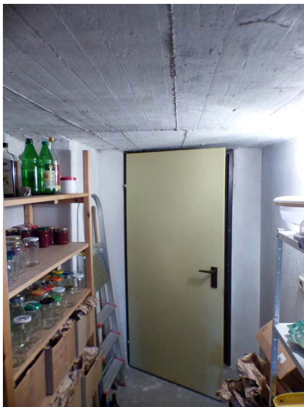
Bild 19 EG Kellerzugang ins Nebengebäude