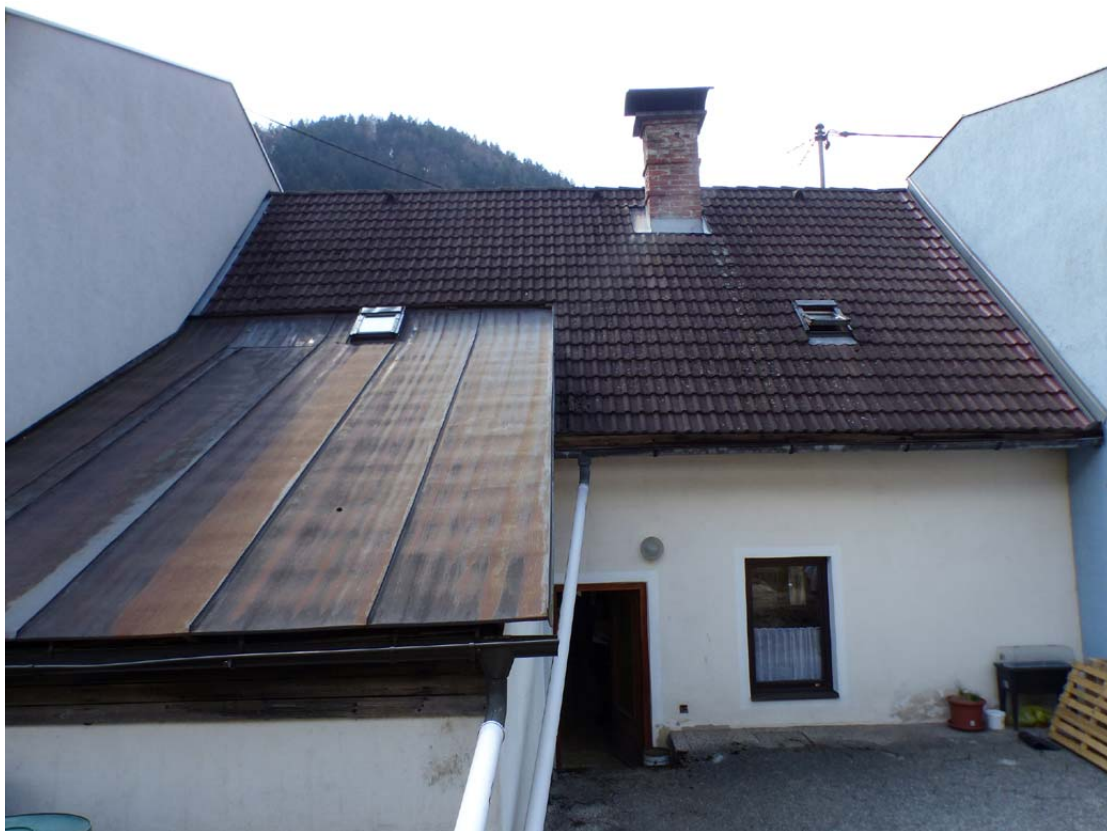
Bild 5 Hofseitige Gebäudeansicht von der Ostseite