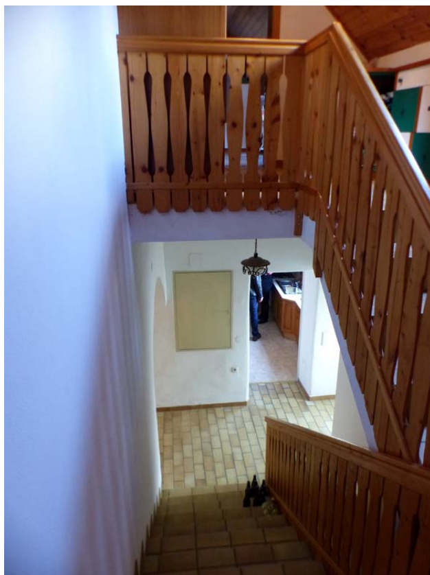
Bild 31 Stiegenhaus mit Zugang zur EG Küche