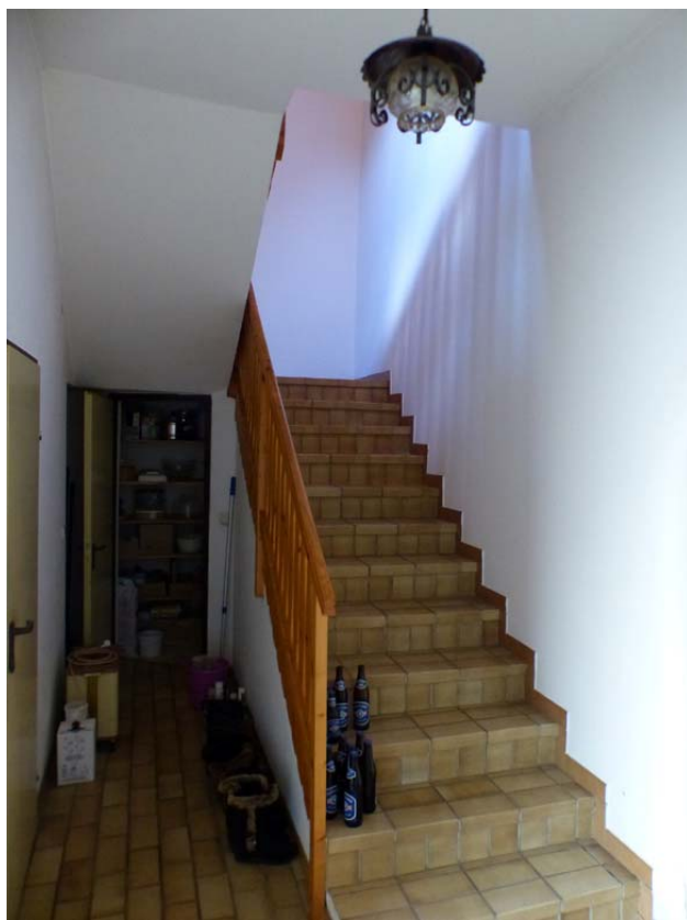
Bild 13 EG Stiegenhaus mit Abstellraum und WC-Zugang