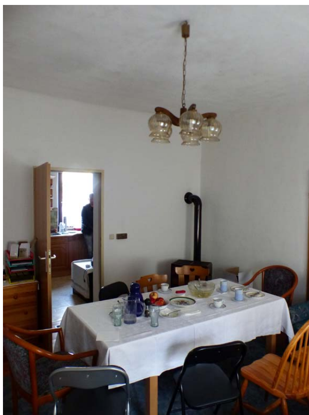
Bild 26 EG Wohnraum an der Nordwestseite mit Zugang von der Küche