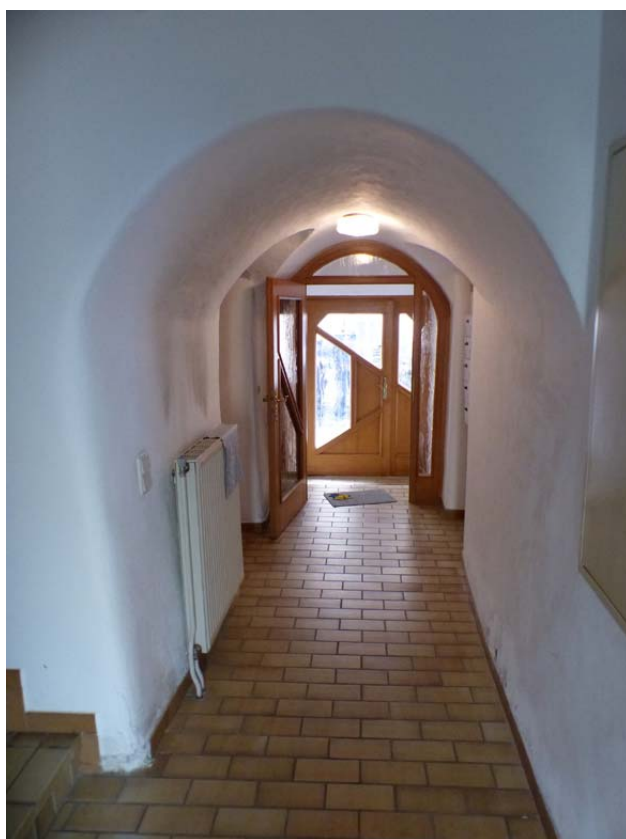
Bild 12 EG Flur mit Windfang und Haustüre zur Schulhausgasse