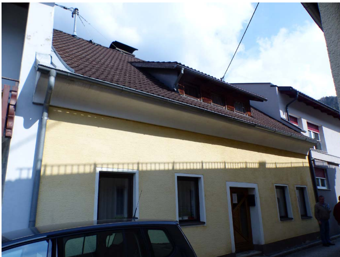
Bild 1 Gebäudeansicht von der Westseite mit Hauszugang von der Schulhausgasse