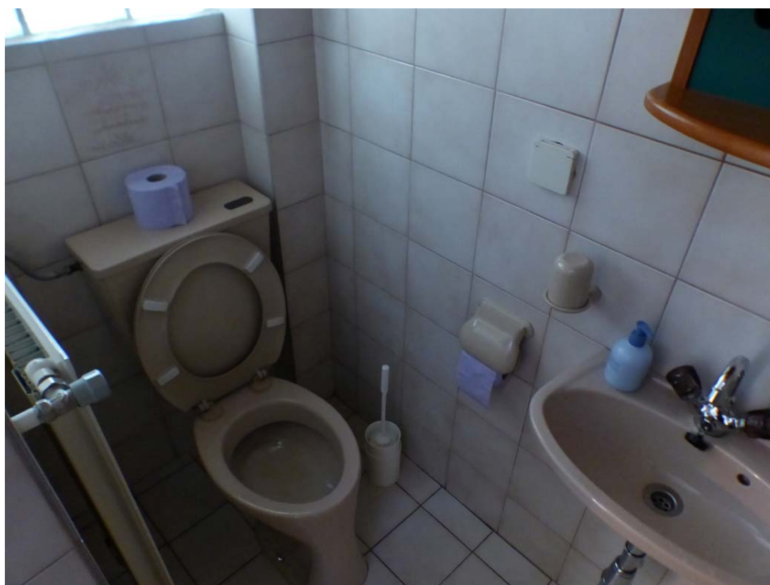
Bild 16 EG WC