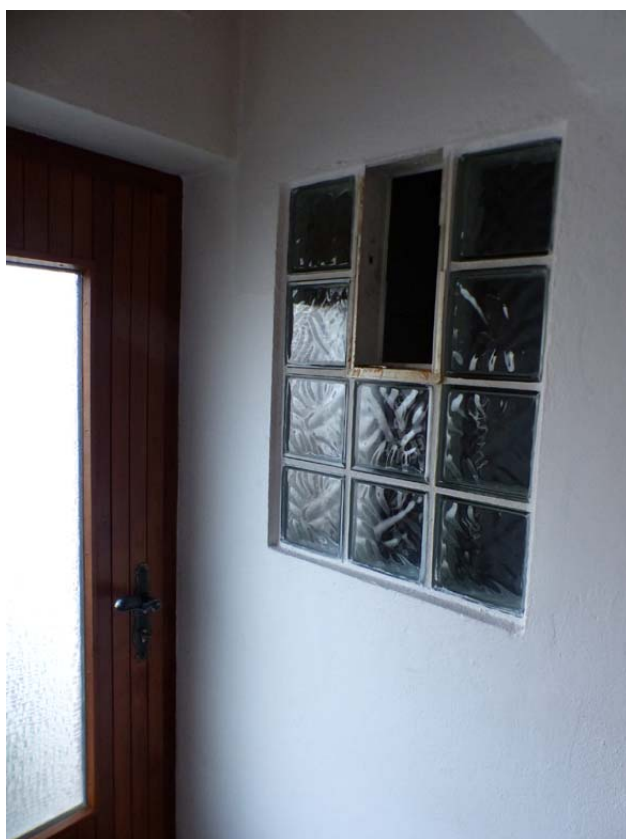
Bild 20 EG WC Fenster mit Hofausgangstüre