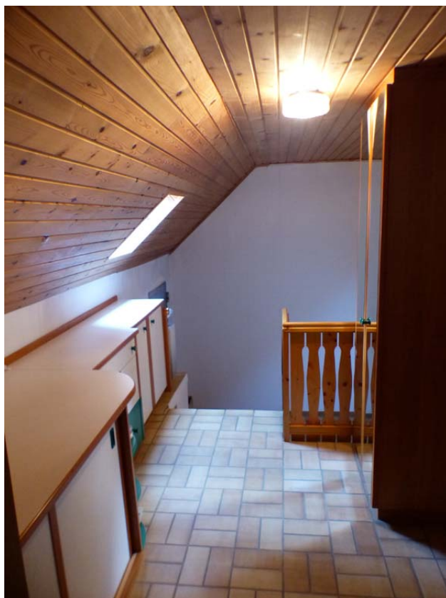
Bild 33 DG Vorraum mit Stiegenhausaufgang