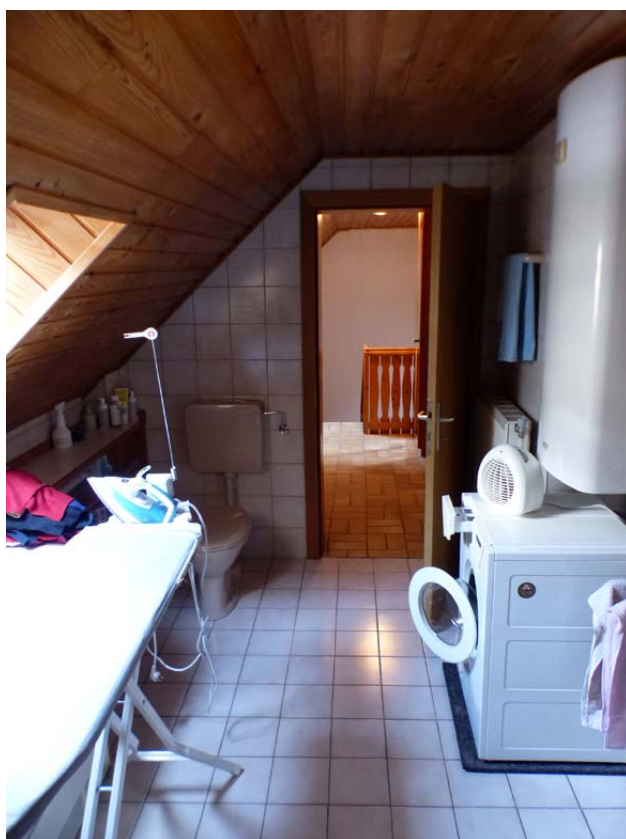
Bild 34 DG Badezimmer