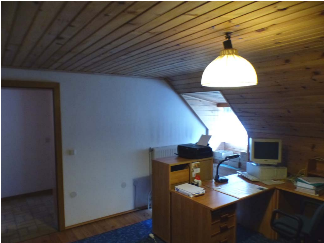
Bild 37 DG Büro mit Dachgaubenfenster zur Schulhausgasse